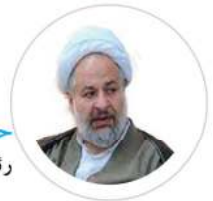
حجت الاسلام روح الامین کلباسی رئیس کنفرانس

مدیر گروه پژوهشی ITM دانشگاه اصفهان استاد تمام دانشگاه اصفهان