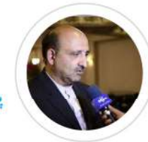
پروفسور علی صنایعی دبیر علمی

مدیر گروه پژوهشی ITM دانشگاه اصفهان استاد تمام دانشگاه اصفهان