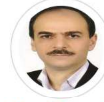
پروفسور مرتضی سامتی استادتمام دانشگاه اصفهان